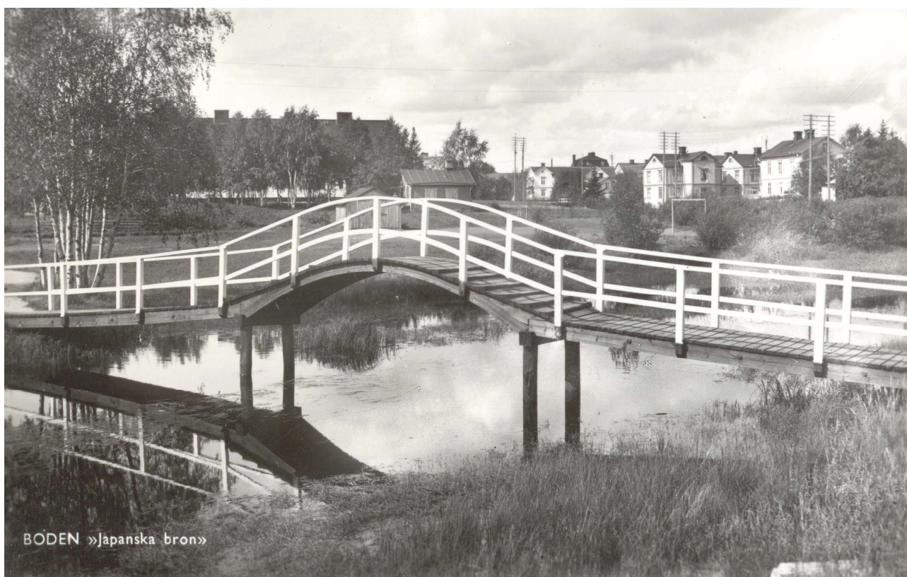
Japanska bron över Bodån från omkring 1950-talet

Vi berättar om höstens program för studiecirklar, resor, radiosändningar och månadsträffar.